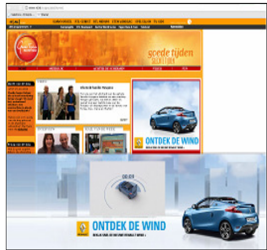
Rich Media: Floor ad