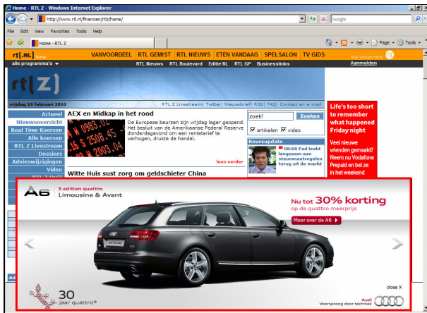
Rich Media: floor ad